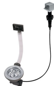
Desagüe automático LIRA 8407 103