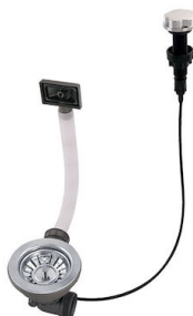
Desagüe automático 8407 000